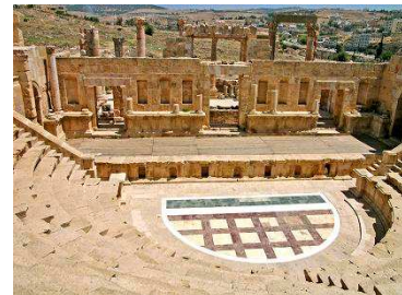
Regreso a Amman, cena y alojamiento

Bajo el dominio romano, la ciudad se llamó Gerasa. A día de hoy, es una de las ciudades romanas mejor conservadas . Oculta durante siglos en la arena, Jerash revela un buen ejemplo del urbanismo romano en todo el Medio Oriente. Cuenta con calles pavimentadas y de columnas, templos , teatros, espaciosas plazas públicas, baños, fuentes y diversas torres y puertas en la muralla de la ciudad.